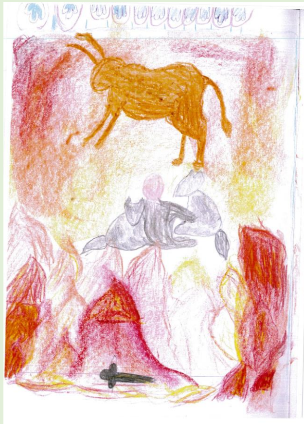
Tegninger fra urtidshistorie i 6. klasse.