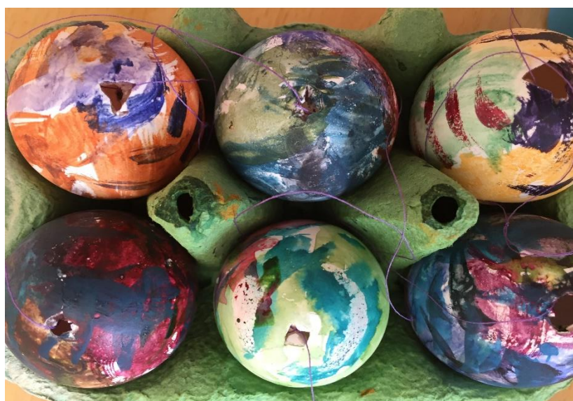
Krokodille-egg, tiger-egg! Utstilling fra en 1.klassing.